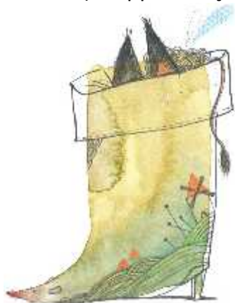
Un chat s'amuse ruse et croque la souris !

En leur compagnie, j'ai ensuite admiré des tableaux dont la composition particulière représente des contes (ils appellent ça Haïkus).