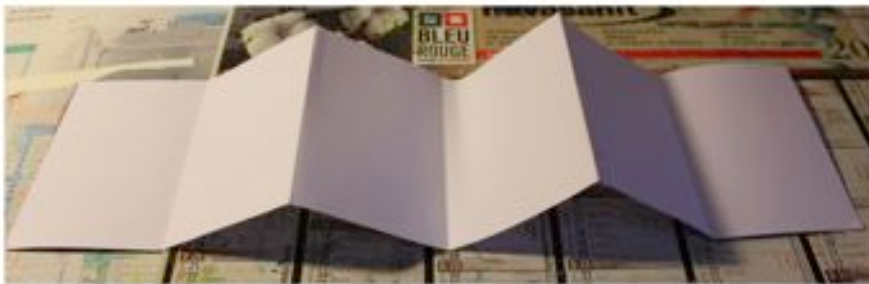
CARNET INTÉRIEUR DÉPLIÉ 60 x 15 CM AVEC 6 PAGES QUI SERONT À INVESTIR EN DESSIN, TEXTE, PHOTO SUR LE THÈME DE VOTRE CHEMIN POUR ALLER À L'ÉCOLE