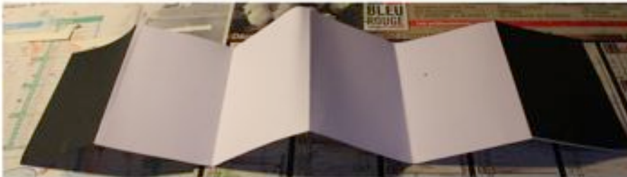
CARNET EXTÉRIEUR DÉPLIÉ 60 x 15 CM, AVEC UNE COUVERTURE ET UNE 4ÈME COUVERTURE NOIRE ( JE COMPTE SUR VOUS POUR FAIRE MIEUX QUE ÇA) + 4 PAGES QUI SERONT À INVESTIR EN DESSIN, TEXTE, PHOTO SUR LE THÈME DE VOTRE CHEMIN POUR ALLER À L'ÉCOLE

- 2 feuilles cartonnées pour renforcer la première et la quatrième de couverture, pour avoir un support rigide.