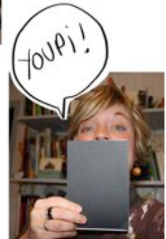
CARNET FERMÉ, ET VOILÀ LA CONFECTION DU SUPPORT EST TERMINÉE

- du matériel de récupération, des beaux papiers, des ciseaux, de la colle, et de l'imagination pour personnaliser vos couvertures. Ces idées graphiques seront à coller sur votre carton de couverture et de quatrième de couverture pour ne pas les laisser brutes comme vous je l'ai fait sur la photo.